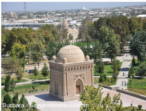
Buchara - Samanidenmausoleum