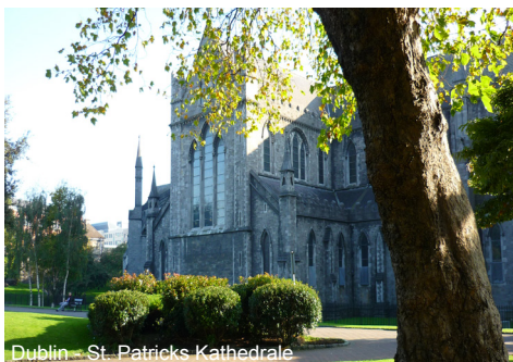
Dublin – St. Patricks Kathedrale