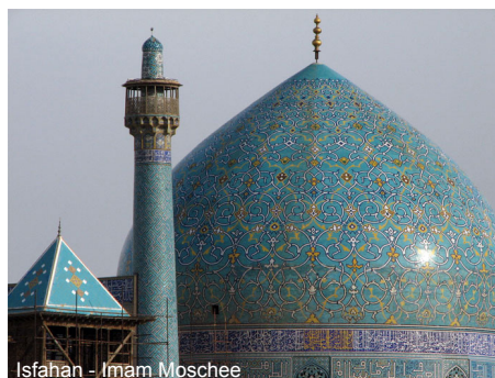
Isfahan - Imam Moschee