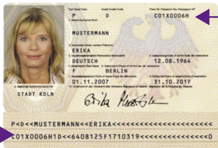
Muster: Reisepass (R)

Hinweise: Für die Meldung an die Fluggesellschaft benötigen wir Ihren vollständigen Namen, so wie im Ausweisdokument neben Ihrem Foto angegeben. Für die Tickets hingegen sind die maschinenlesbaren Angaben relevant, s. untere Markierung. Kennzeichnen Sie diese Angaben entsprechend oder übermitteln Sie uns eine Kopie Ihres Ausweisdokuments. Bei fehlerhaften Angaben muss das Ticket kostenpflichtig neu ausgestellt werden. Die Ausweisnummer ist bei den entsprechenden Markierungen abzulesen. Eine Beförderung mit fehlerhaften Angaben im Flugdokument ist nicht gewährleistet.