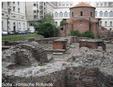
Sofia - römische Rotunde

Sollten Sie innerhalb von 4 Jahren eine Reisegruppe mit mindestens 16 Teilnehmern in das gleiche Zielland bei uns buchen, erhalten Sie den umseitig genannten Gruppenplanerpreis erstattet.